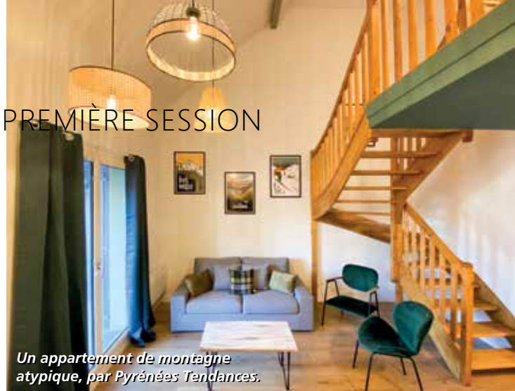
Un appartement de montagne atypique, par Pyrénées Tendances.