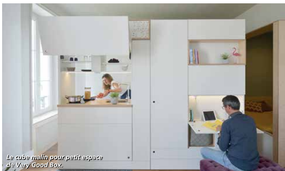
Le cube malin pour petit espace de Very Good Box.