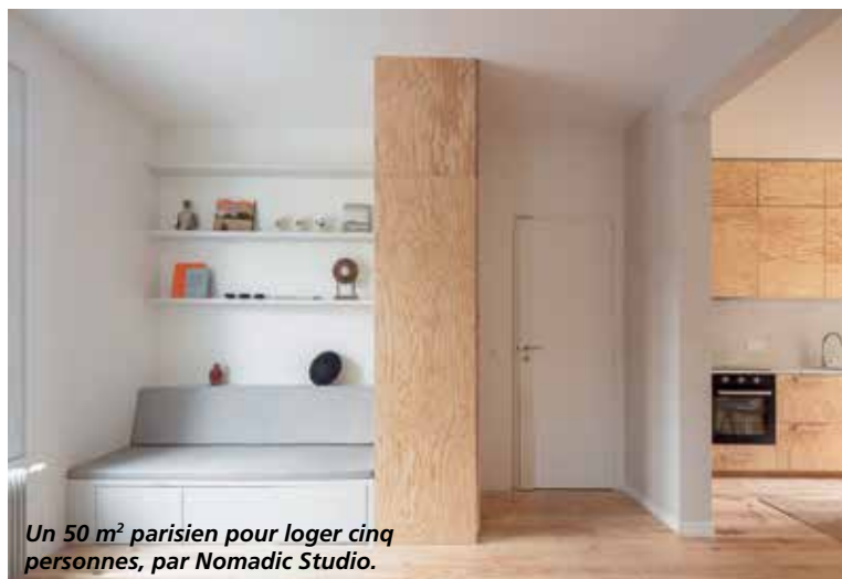
Un 50 m 2 parisien pour loger cinq personnes, par Nomadic Studio.