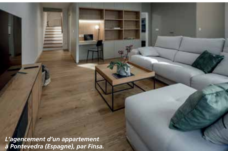
L'agencement d'un appartement à Pontevedra (Espagne), par Finsa.