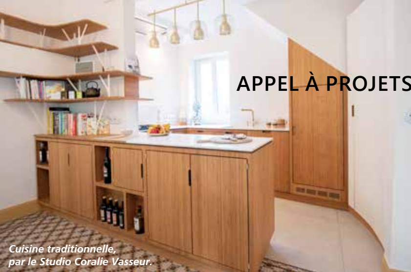
Cuisine traditionnelle, par le Studio Coralie Vasseur.