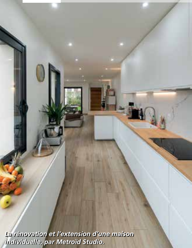
La rénovation et l'extension d'une maison individuelle, par Metroïd Studio.

Voici un rapide aperçu des sept autres projets finalistes, à découvrir en détail sur nos réseaux sociaux.